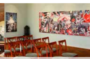
Weißes Haus Buchenzimmer